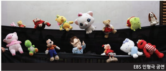
EBS 인형극 공연